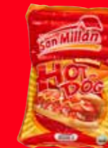
San Millán Hot Dog Viena de Pavo México/ A granel