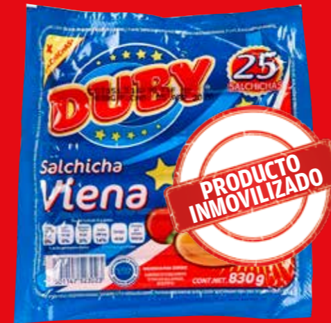
DUBY Salchicha Viena México/ 830 g (una de tres unidades)