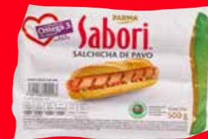
PARMA Sabori Salchicha de pavo adicionada con Omega 3 de linaza México/ 500 g