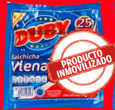
DUBY Salchicha Viena México/ 830 g