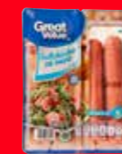
Great Value Salchicha de pavo Reducida en sodio México/ 500 g