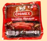
CHIMEX Salchicha para asar.