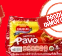
BURR Salchicha de pavo México/ 400 g