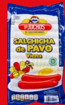
go JOCHOS EL SALCHICHERO Salchicha de pavo Viena México/ A granel