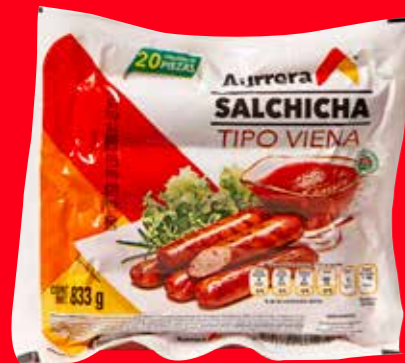
Aurrera Salchicha tipo Viena México/ 833 g