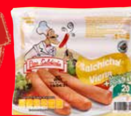
Pepe Salchicha Salchicha Viena México/ 800 g