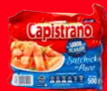
Capistrano Salchicha de pavo México/ 500 g