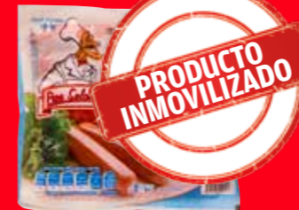
Pepe Salchicha Salchicha de pavo México/ 800 g