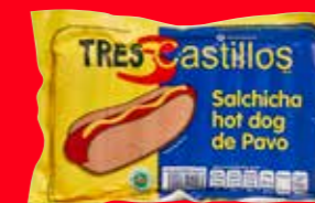
TRES CASTILLOS Salchicha hot dog de pavo México/ A granel