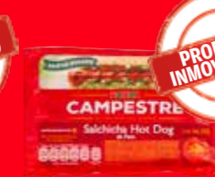
PARMA CAMPESTRE Salchicha Hot Dog de pavo México/ 500 g