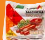
Aurrera Salchicha tipo Viena México/ 833 g