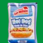
San Millán Salchicha Hot Dog México/ A granel