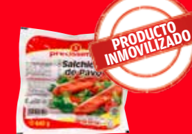
precissimo Salchicha de pavo México/ 640 g