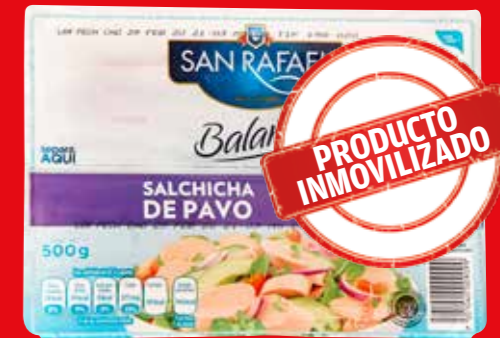
SAN RAFAEL Balance Salchicha de pavo México/ 500 g (dos de tres unidades)