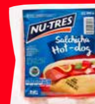
NU-TRES Salchicha Hot dog México/ 500 g