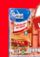
Great Value Salchicha de pavo México/ 500 g