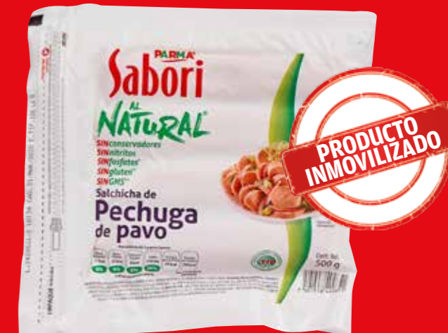
PARMA Sabori AL NATURAL Salchicha de pechuga de pavo/ 500 g

Dice ser producto de pavo pero también contiene pollo. Ostenta la leyenda "sin conservadores" pero sí los contiene.