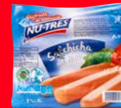
NU-TRES Salchicha de pavo México/ 500 g