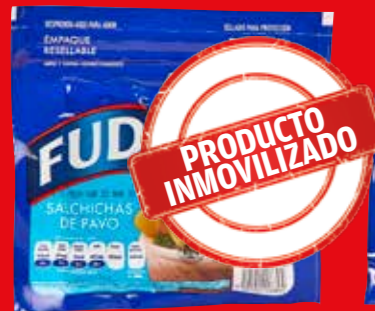
FUD Salchichas de pavo México/ 1 kg