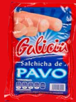
Galicia Salchicha de pavo México/ A granel