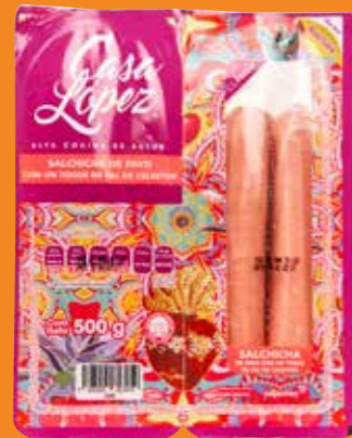
Casa López Salchicha de pavo México/ 500 g