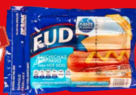
FUD Salchichas de pavo para Hot dog México/ 500 g