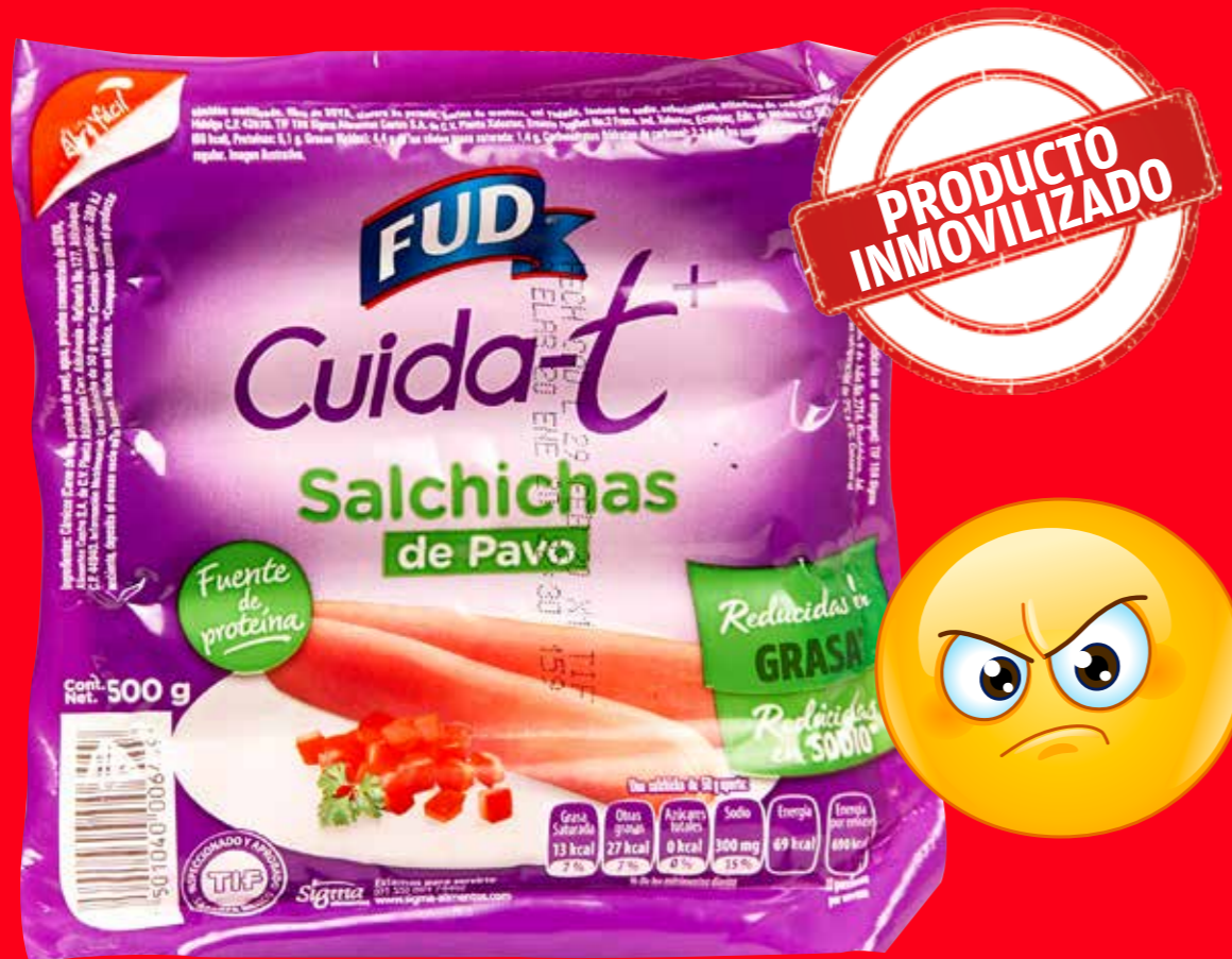
FUD Cuida-t Salchichas de pavo / México/ 500 g