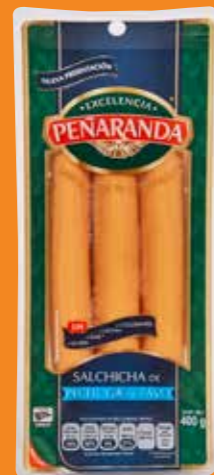
PEÑARANDA Salchicha de pechuga de pavo México/ 400 g