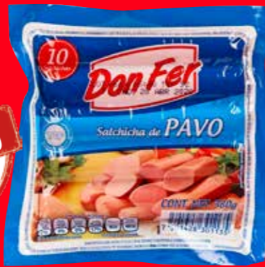
Don Fer Salchicha de pavo México/ 380 g