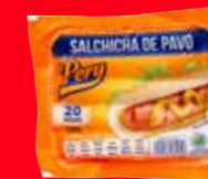
Pery Salchicha de pavo México/ 620 g