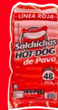
LÍNEA ROJA Salchicha Hot Dog de pavo México A granel.

Presentes por la adición de féculas, almidones y harinas.