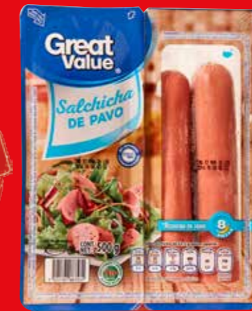
Great Value Salchicha de pavo Reducida en sodio México/ 500 g (una de tres unidades)