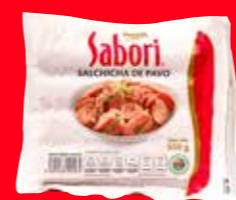
PARMA Sabori Salchicha de pavo México/ 500 g