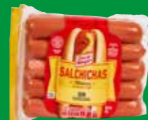
Oscar Mayer Salchichas clásicas de pavo, pollo y cerdo / E.U.A. / 454 g

La presencia de almidón abarata los costos de fabricación y hace más energéticos a los productos. Las siguientes marcas no lo adicionan: